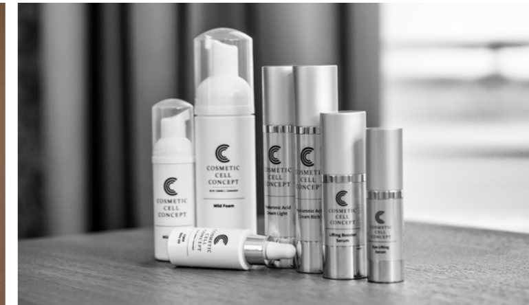
Die Pflegelinie «CCC – Cosmetic Cell Concept», erhältlich auf www.colette-camenisch.com/shop/ .